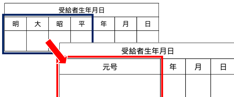
[参考] 出典:国税庁「令和2年分 給与所得の源泉徴収票の記載の仕方」 https://www.nta.go.jp/publication/pamph/pdf/0020004-166.pdf

受給者の生年月日の元号表記欄が、記載欄へと変わりました。当てはまる元号に“ ”を付すのではなく、“明治”、“大正”“昭和”、“平成”又は“令和”と 漢字で記載 します。